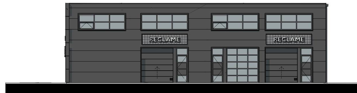
ZIJGEVEL - NOORD