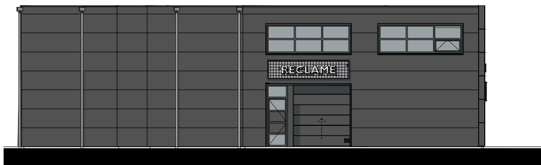
ZIJGEVEL - ZUID